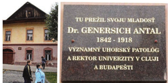
Késmárki utcarészlet, Genersich Antal nagyszüleinek háza

Tudományos eredményei közül kiemelkedik az, hogy elkülönítette a Mycobacterium tuberculosis -t a M. bovis -től a kórszöveti elváltozások alapján, leírta a tüdőembóliát, az enterocolitis necrotisanst és következményeit, ez utóbbi első leírójaként napjainkban is idézik. Az Erdélyi Múzeum Egyesület elnöki teendőit közel 20 évig látta el. 1891-ben sokoldalú, a közért végzett tevékenységének elismeréseként szepesszombati előnévvel nemesi címet kapott. A Magyar