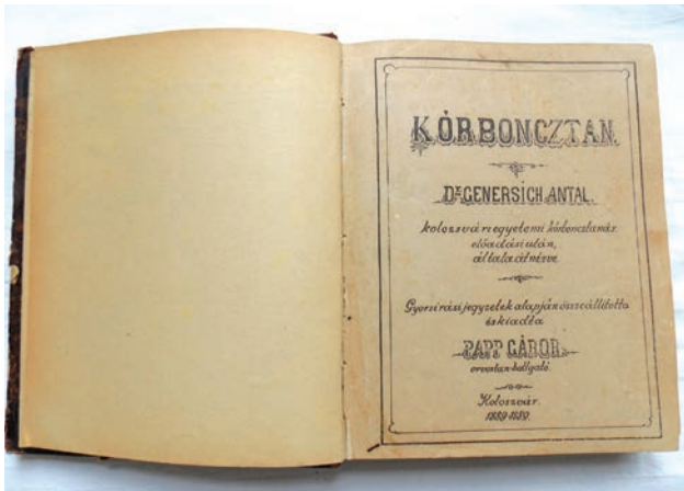
Genersich Antal tantermi előadásai alapján készített „könyvmatos” jegyzet, az. 1. kötet címlapja

Tudományos Akadémia 1892-ben levelező, majd 1906-ban rendes tagjává választotta.