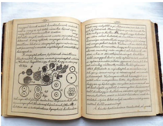
Szöveg és kép a „könyvmatosból”: a daganatsejtek fejlődési mechanizmusa

25 évi kolozsvári munkásság után 1895-ben tért vissza a fővárosba. A budapesti I. Sz. Kórbonctani Intézet tanszékvezetőjeként folytatta tevékenységét; itt is az oktatást tekintette fő feladatának. E tevékenységét értékelve 1904–1906-ban dékánnak, majd az 1910/11-es tanévben az egyetem rektorának választották. Genersich tanári és proszektori tevékenységének eredményeként korszerűen felszerelt kórházi prospektúrák széles hálózata épült ki országszerte. Több külföldi szakíró azt emelte ki Genersich legnagyobb érdeméül, hogy a kórtanba bevezette az anatómiai és a tiszta termé-